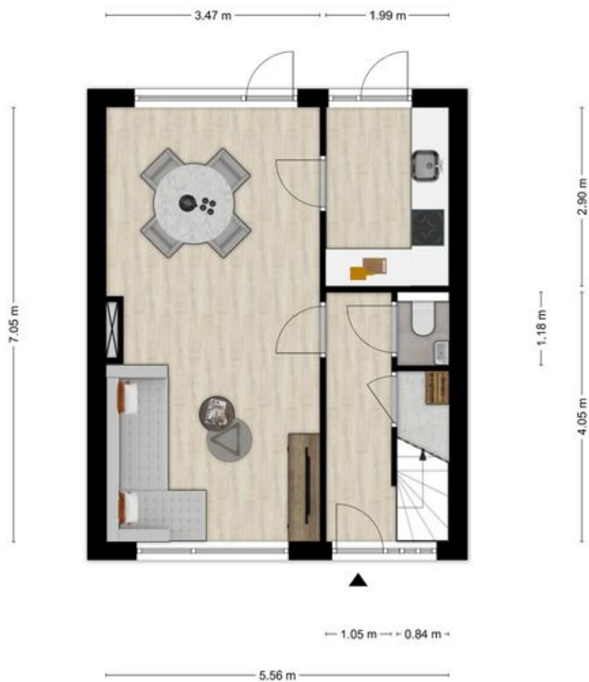
Aldenhaagstraat 13 te Nijmegen Begane Grond

Aan de plattegronden kunnen geen rechten worden ontleend. © Tekenplan Vastgoedpresentatie